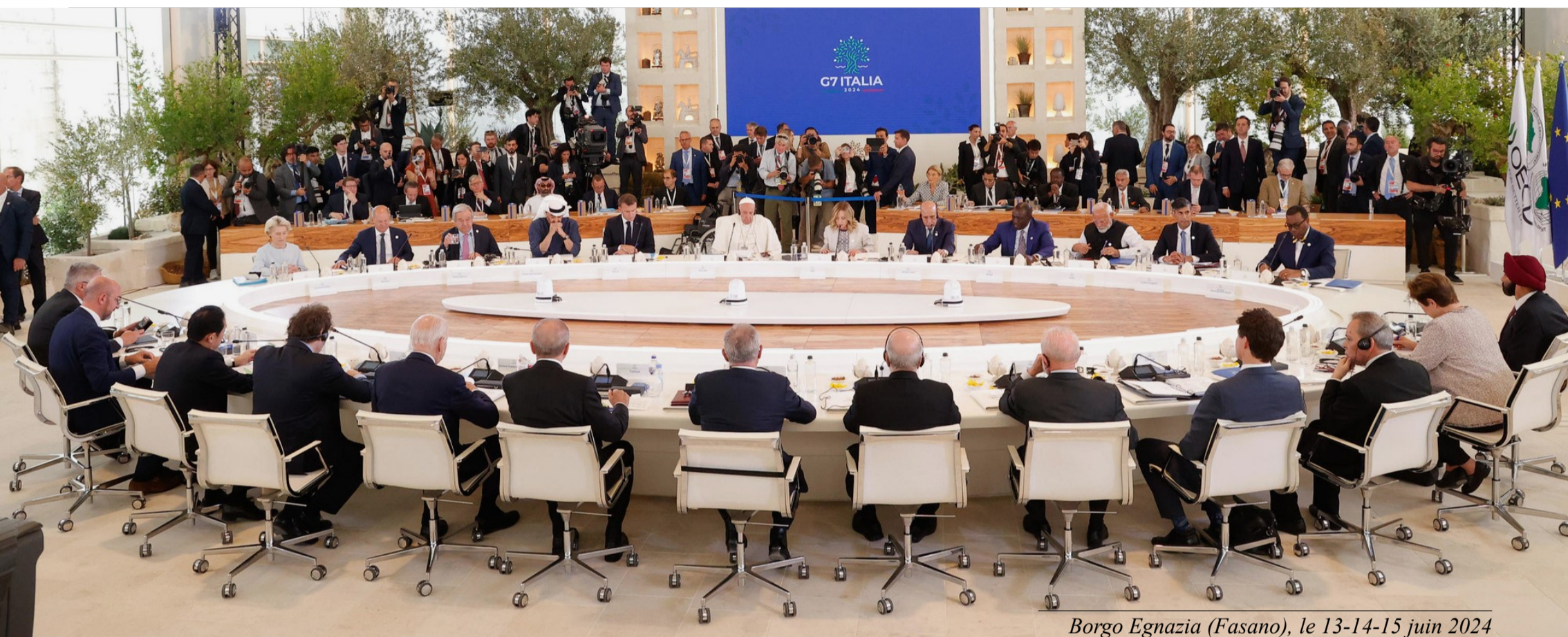
Borgos Egnazia (Fasano), le 13-14-15 juin 2024